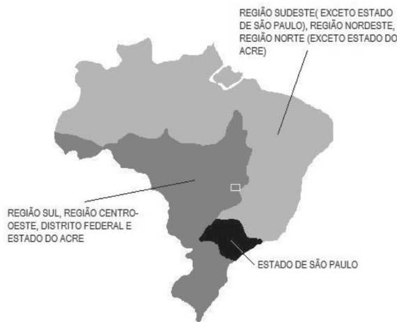
FIGURA 1 - Distribuição geográfica por regiões do STFC

A Figura 1 apresenta a divisão simplificada da universalização do STFC por área geográfica: a região I é apresentada em cinza claro, a região II, em cinza escuro e a região III, em preto. Uma quarta região englobou a concessão para operação de serviços de telefonia de longa distância nacional e internacional em todos os estados e no distrito federal. Originalmente, a quarta região foi concedida à Embratel (Empresa Brasileira de Telecomunicações) que operava em todo o país, com restrições iniciais de exploração dos serviços locais (ANATEL, s.d. (a)).